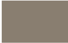
L04 - Titanio opaco/ Matt Titanium