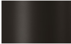
V03 - Antracite/Anthracite