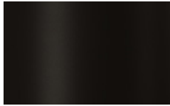
V01 - Nero/Black

I metalli della nostra collezione vengono verniciati a polvere così da rivestire le nostre superfici a scopo decorativo e protettivo. Lo spessore finale della verniciatura a polveri, risulta particolarmente elevata contribuendo ad una serie di rilevanti vantaggi sul prodotto verniciato: resistenza meccanica, resistenza agli agenti corrosivi, scarsa infiammabilità, precisione nell'applicazione. Le verniciature a polveri utilizzate sono totalmente atossiche e prive di solventi, per questo motivo la verniciatura a polveri è una lavorazione ECO-FRIENDLY, a bassissimo impatto ambientale. Disponibile la versione cromata dove il metallo o l'alluminio vengono rivestiti di cromo, conferendogli così durezza, resistenza chimica e resistenza all'ossidazione. / The metals in our collection are powder coated in order to coat our surfaces for decorative and protective purposes. The final thickness of the powder coating is particularly high contributing to a series of advantages for the painted product: mechanical resistance, resistance to corrosive agents, low flammability, precision in the application. The powder coatings used are non-toxic and solvent-free, for this reason powder coating is an ECO-FRIENDLY process, with a very low environmental impact. The chrome version is available where the metal or aluminum is coated with chrome, giving it hardness, chemical resistance and resistance to oxidation.