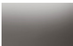
CR3 - Cristallo specchiato Fumè/ Fumè mirrored glass