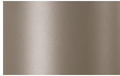
V04 - Titanio/Titanium