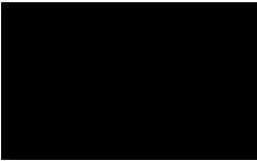
L01 - Nero opaco/ Matt Black

I laccati sono composti da un pannello in MDF (medium Density Fibre Board) verniciato su entrambi i lati. / Lacquered products are made of a MDF (medium Density Fibre Board) painted panel on both sides.