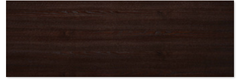
FTM - Frassino tinto Testa di Moro/ Dark Brown stained Ash