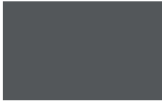
L03 - Antracite opaco/ Matt Anthracite