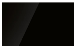
CR1 - Cristallo verniciato Nero lucido/Glossy Black painted glass