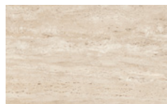
CM11 - Travertino opaco / Matt Travertino NEW