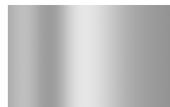
ASP - Alluminio Spazzolato/ Polished Aluminium