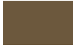
L05 - Bronzo opaco/ Matt Bronze