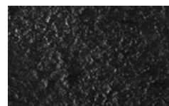
RI1 - Cristallo martellato Nero lucido/Glossy Black hammered glass