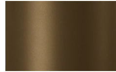
V05 - Bronzo/Bronze