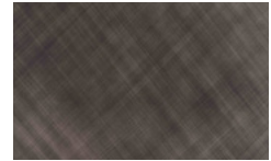
L07 - Bronzo spazzolato/ Brushed Bronze