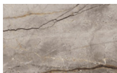
CM13 - Silver Root opaco / Matt Silver Root NEW