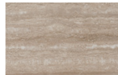
M05 - Travertino opaco/ Matt Travertino NEW