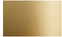
V06 - Oro/Gold