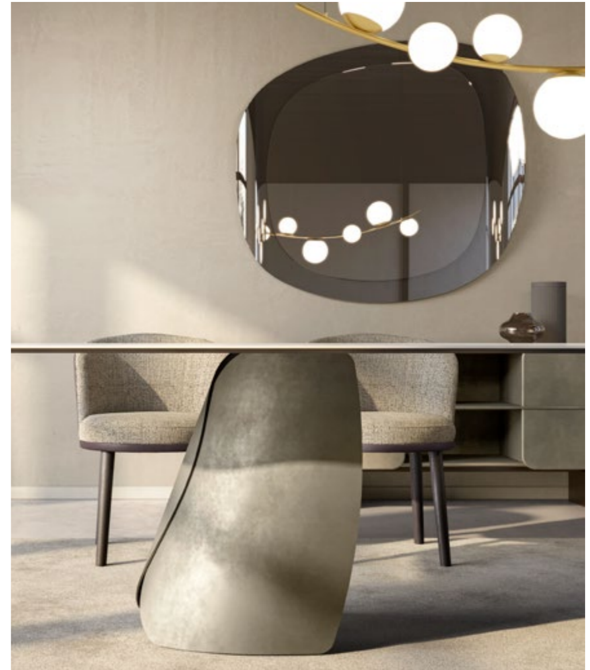
PERLA_top ceramic tavolo, cm 300x120 sagomato, base: platino spazzolato, piano: ceramica Calacatta Macchia Vecchia lucido. GINGER_4 gambe legno poltroncina, gambe: frassino testa di moro, seduta: tessuto B 500, schienale pelle 5270 testa di moro. VIDA 2_sospensione lampada, oro spazzolato · NINFA madia, cm 200x48x h 75, laccato platino spazzolato. GALLERY specchio, cm 132x122 cristallo specchiato fumè · DORIA tappeto, T 402.